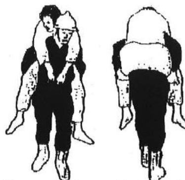
Przenoszenie przez jedną osobę chwytym "na barana"