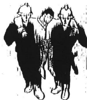
Przenoszenie przez dwie osoby sposobem "kombinowanym"