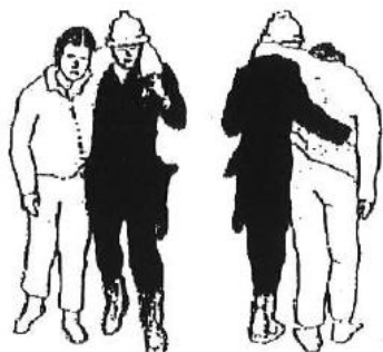
Wyprowadzanie przez jedną osobę