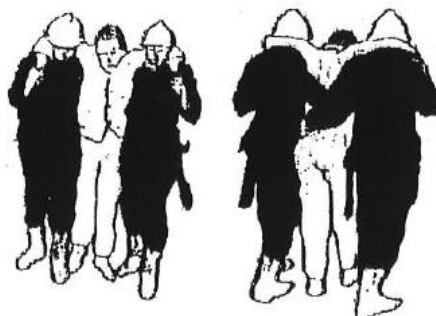
Wyprowadzanie przez dwie osoby